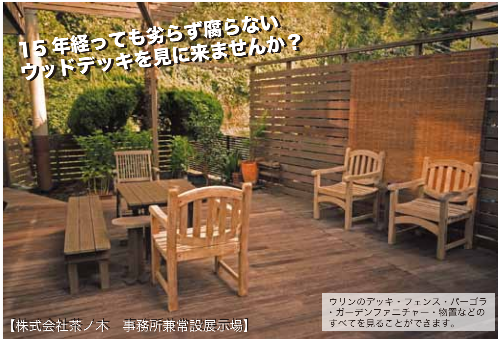
【株式会社茶ノ木 事務所兼常設展示場】